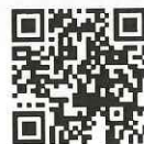
電子保証の仕組み